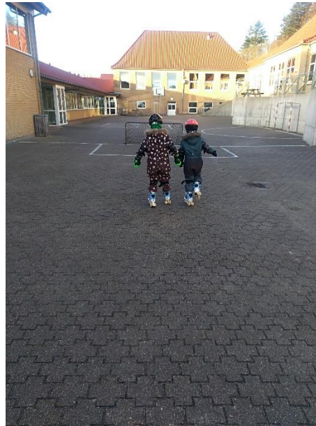
Selvom der vinter kan vi da godt køre på rulleskøjter.