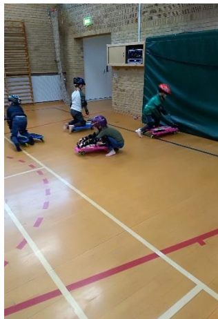
Vi kører på Flyers i gymnastiksalen