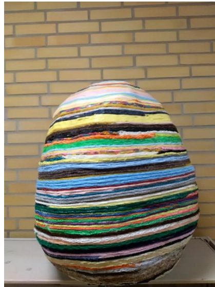
Påskeæg lavet af fingerstrik

SFO'en er lukket 24. og 31. December, samt fredag efter Kr.Himmelfart og Grundlovsdag. Endvidere er der lukket uge 29 og 30, samt mellem jul og nytår, her tilbydes alternativ pasning om nødvendigt.